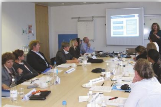
Kép a találkozóról