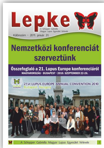
Lepke különszám címoldal

A kiadványban szakmai és képes összefoglaló található a rendezvényről, valamint elolvasható a megjelent európai országok képviselőinek nemzetközi riportja is.