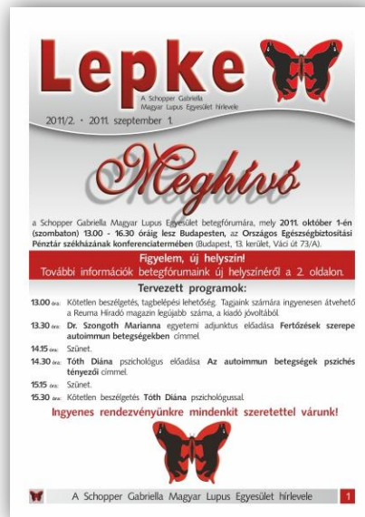
2011/2. szám címloldal