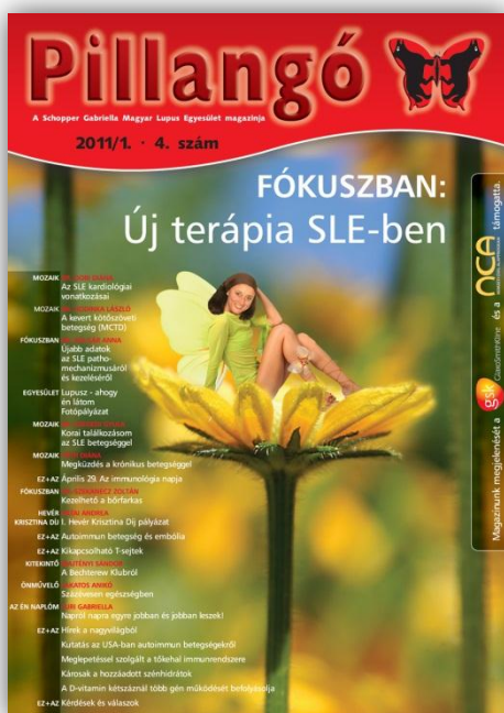
Pillangó magazin – 2011/1 – 4. lapszám – 2011. december 15.

Pillangó című magazinunk Magyarországon hiánypótló, hiszen nincs egy olyan lap sem, amely közvetlen autoimmun betegek számára jelenik meg. Egyesületünk kiemelt célja, hogy a magyar autoimmun betegek több tízezres táborát tájékoztassa.