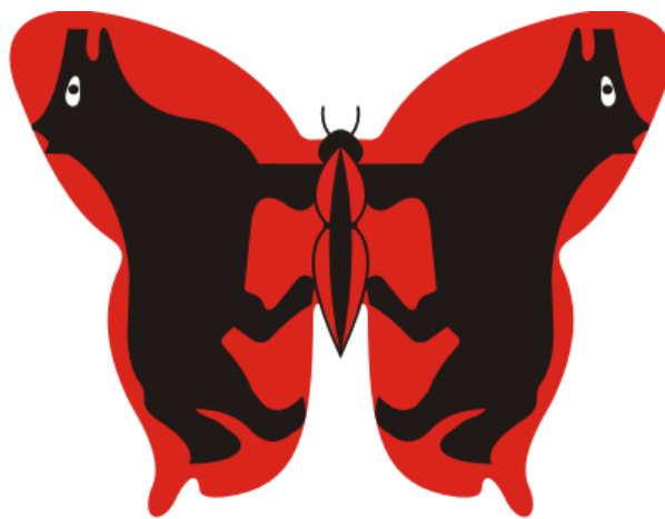
Magyar Lupus Egyesület