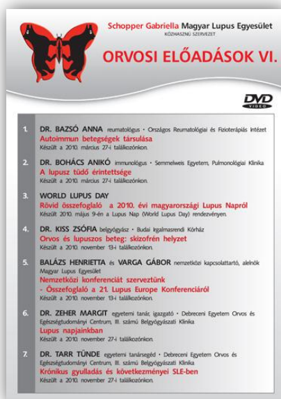
A 6. DVD borítója