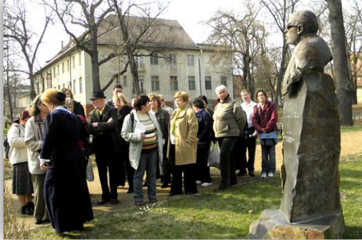
Idegenvezetés a klinika parkjában

A betegfórum után a debreceni Autoimmun Beteggyesület idegenvezetéses városnézést szervezett a Magyar Lupus Egyesület tagjainak. Sok nevezetességet láthattunk, jól éreztük magunkat ezen a szép tavaszi napon.