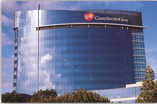
A GlaxoSmithKline londoni központja