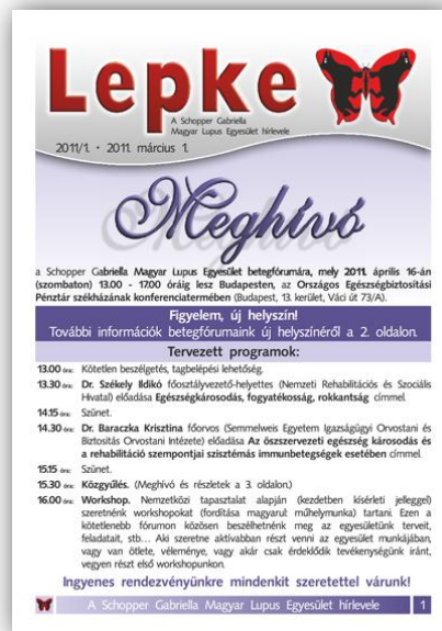
2011/1. szám címloldal