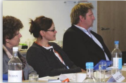
Kép a találkozóról